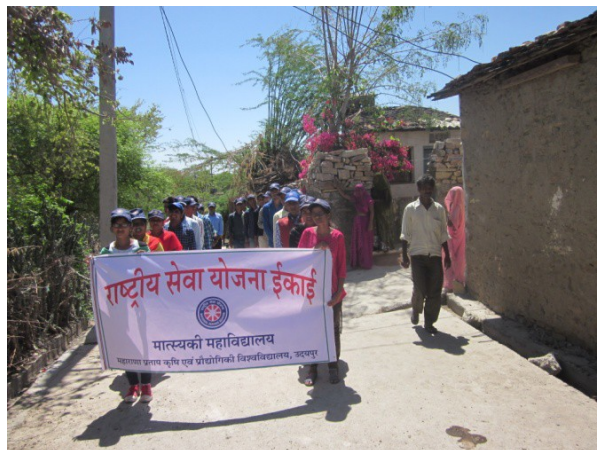
Rally by the NSS volunteers for mass awareness and appeal for 'save the girl child and educate them'