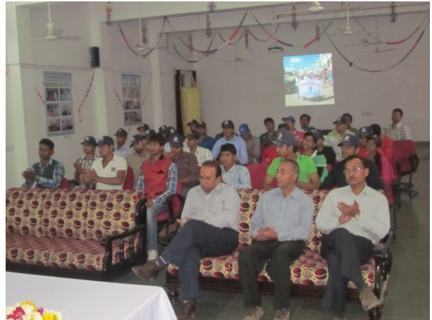
Closing function of NSS 7 days special camp