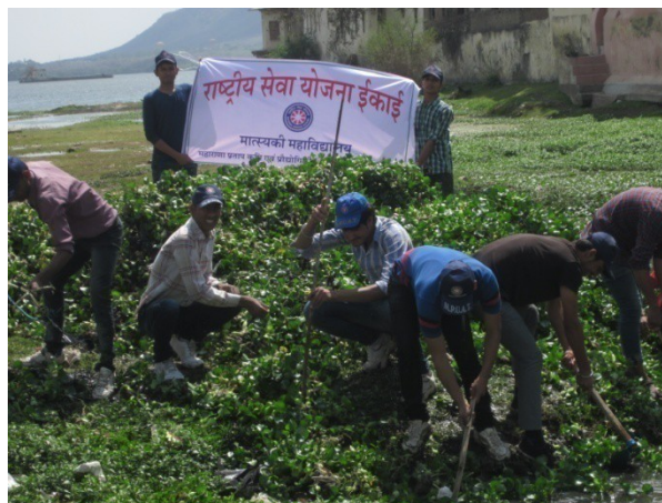
Removal of aquatic weed and cleaning of surrounding area outside Bhrampole near Lake Picchola