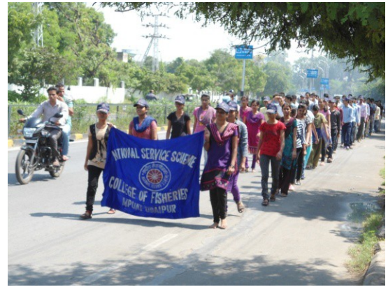
Oath taking and Jan Chetna rally by the NSS volunteers 2 nd October (Swachh Bharat Abhiyan