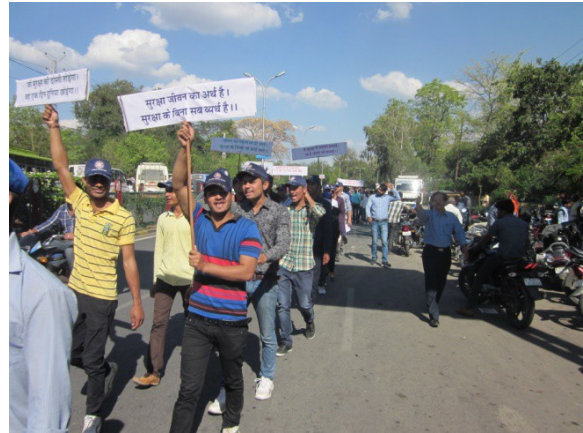
Rally by the NSS volunteers for mass awareness for helmet and road safety rules