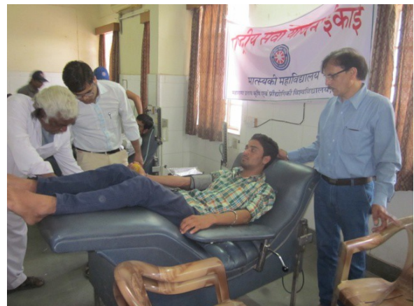
Blood donation by the NSS volunteers in M.B. Hospital, Udaipur