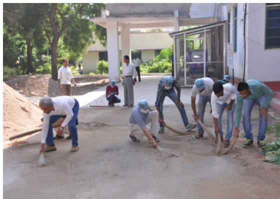
Campus Cleaning by the NSS Volunteer in Swach Bharat Abhiyan on 2 nd October